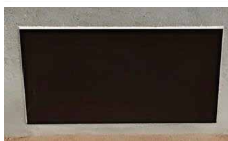
浸水時(止水シート取り付け)