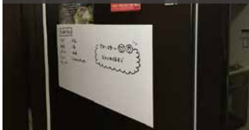
ホワイトボードとして使用