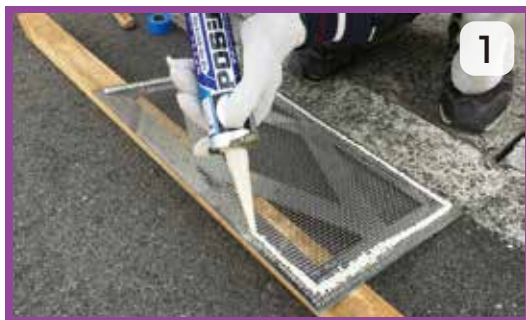
シーリング材及び仮止用接着剤を受枠に塗布する