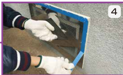
マスキングテープを剥がして完成