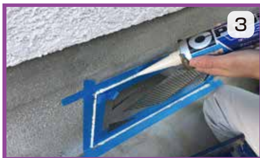
壁面と受枠の隙間にシーリング材を塗布して仕上げる