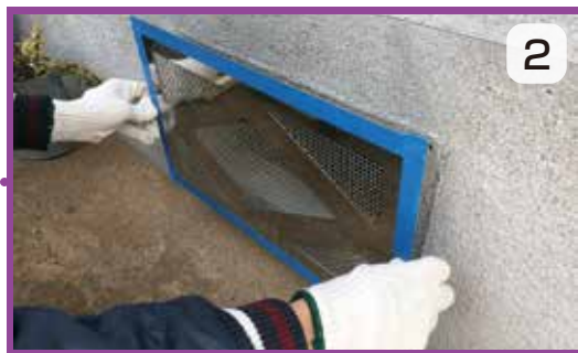
マスキングテープを貼り付ける